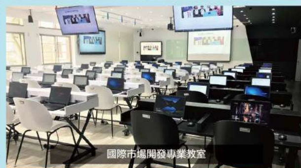
國際市場開發專業教室

歡迎到龍華首頁招生資訊：111進修部四技單獨招生，下載簡章與報名表，立即上網預約報名，免收報名費。