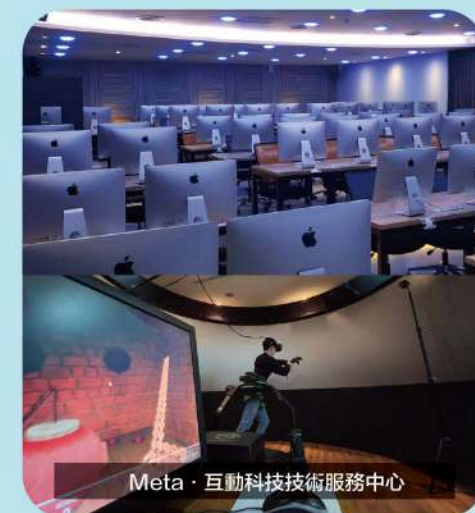
Meta·互動科技技術服務中心

進修部申請入學免統測/學測， 科系 多元選擇 ，學費僅日間部 一半 ，畢業學位證書與日間部 相同，可依規定轉學考至日間 部或轉系(不用考試)。