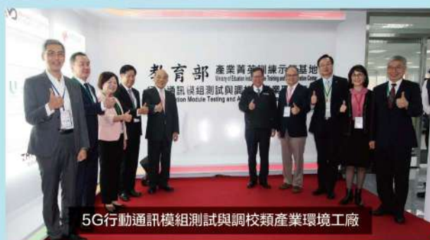
5G行動通訊模組測試與調校類產業環境工廠