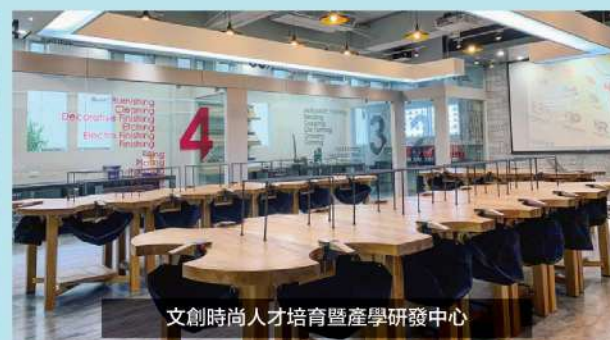
文創時尚人才培育暨產學研發中心