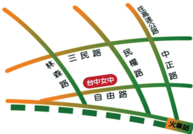
臺中市立臺中女子高級中等學校 110 學年度校園配置圖