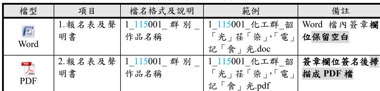
表 2-2 專題組電子檔光碟範例說明