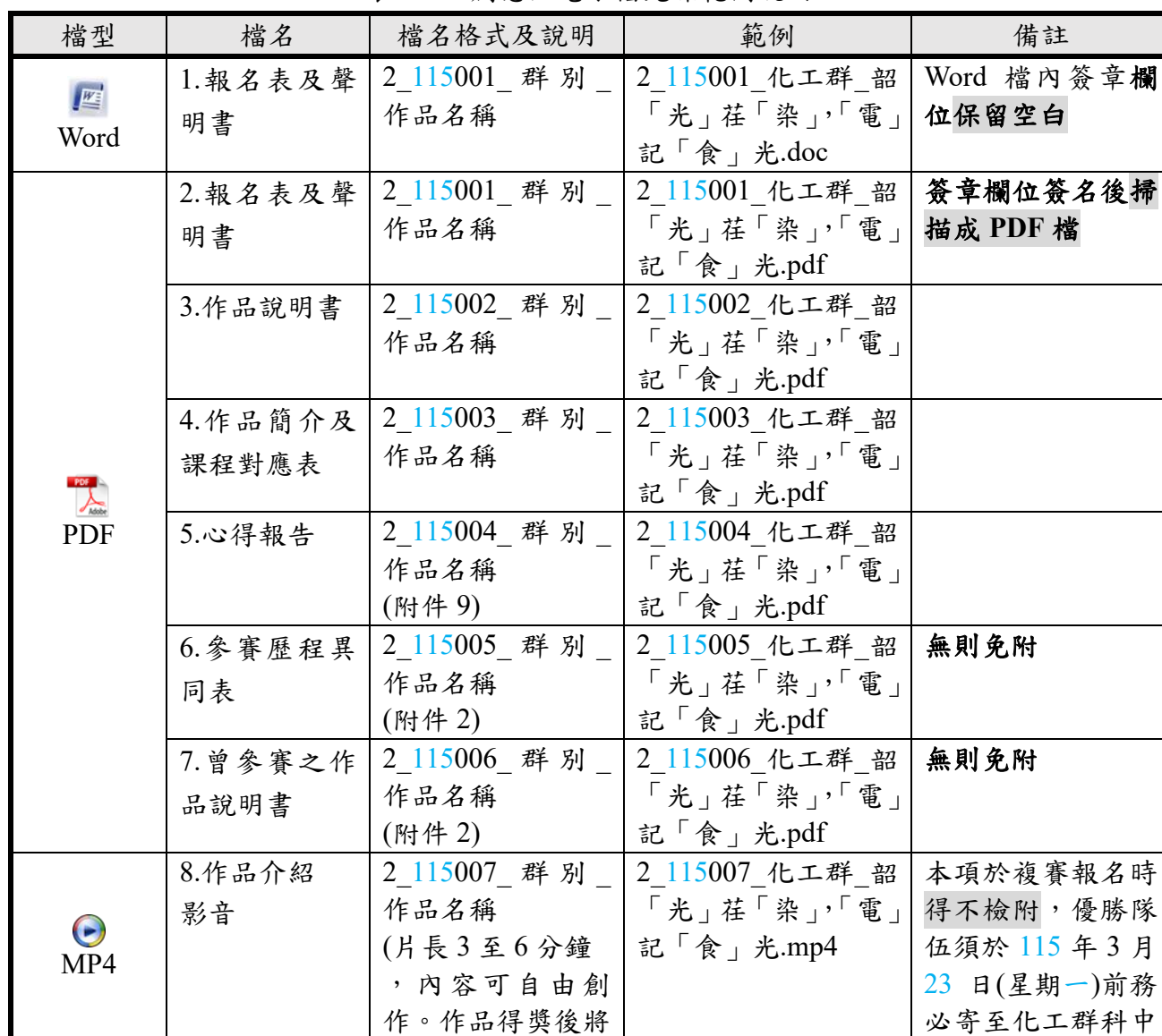
表 2-4 創意組電子檔光碟範例說明